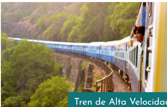
Tren de Alta Velocidad París y Niza