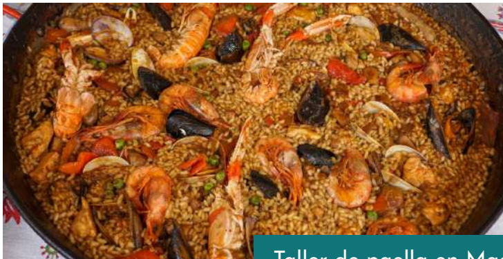
Taller de paella en Madrid o Cena de tapas.