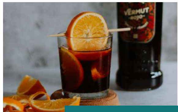
Cata de Vermuth en Madrid bohemio