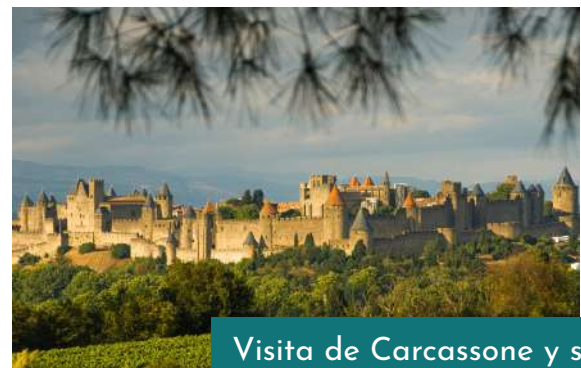
Visita de Carcassonne y su imponente Castillo