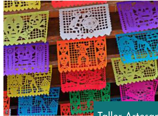
Taller Artesanal del Papel Picado