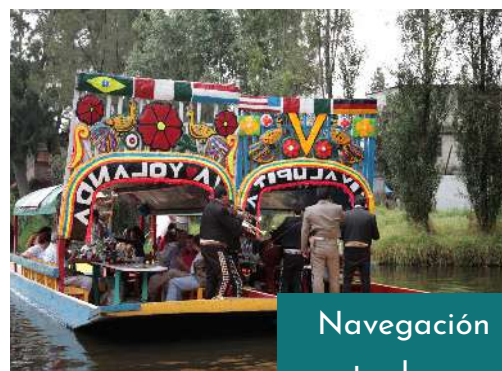
Navegación entre las aguas y las flores en Xochimilco