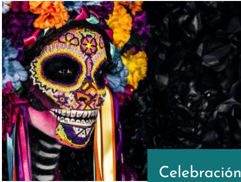
Celebración del día de los Muertos en la Isla de Janitzio