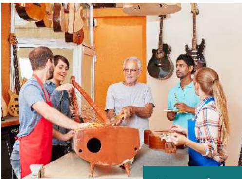
Visita de un Taller Laudero.