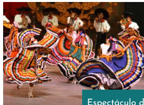
Espectáculo de Danza y Folclore Mexicano.