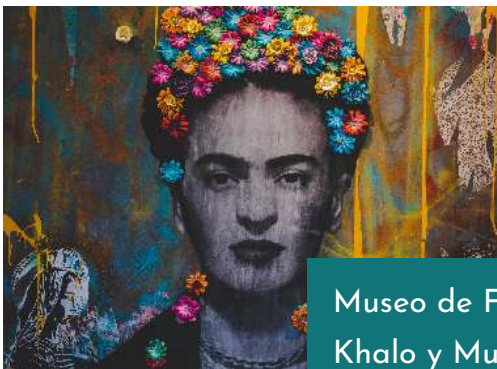
Museo de Frida Khalo y Museo de Antropología.